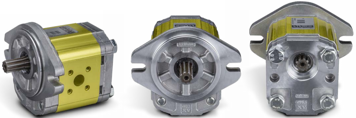
"Schrauben als Transportsicherung"

Frontflansch: Alu Körper: Alu Anbaufansch: Alu